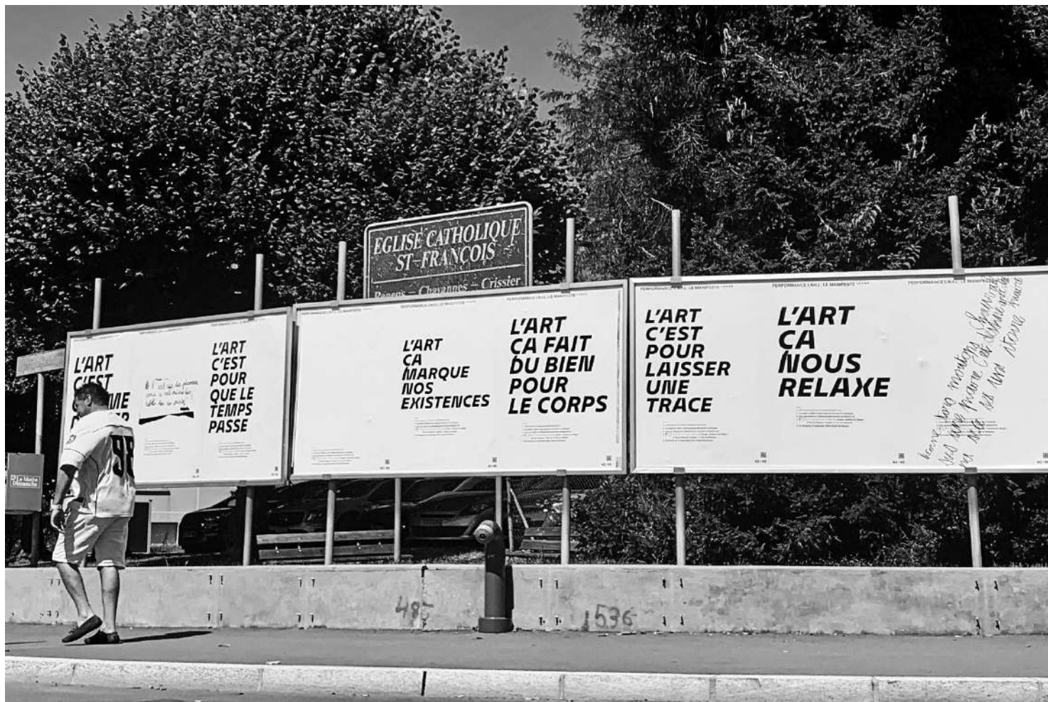
A Renens, le manifeste «L'Artz» se déploie sur des panneaux d'affichage à quatre endroits de la ville. MARIE-AUDE GUIGNARD

Après avoir invité les enfants à (re)définir l'art, la performeuse Marie-Aude Guignard compose un manifeste poétique dans l'espace public avec leurs slogans, à Renens, et bientôt à la Chaux-de-Fonds