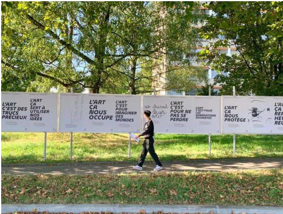
Les affiches du Manifeste poétique de Marie-Aude Guignard.