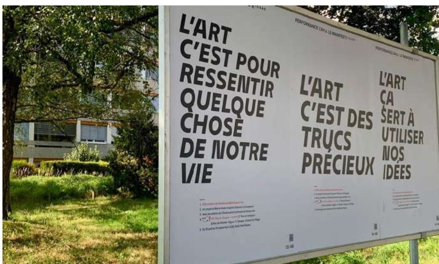
L'art de savoir ou du savoir l'art s'affiche ! / Vertigo / 5 min. / le 22 août 2024

Arts visuels, publié le 28 août 2024 Propos recueillis par Florence Grivel Adaptation web: Id